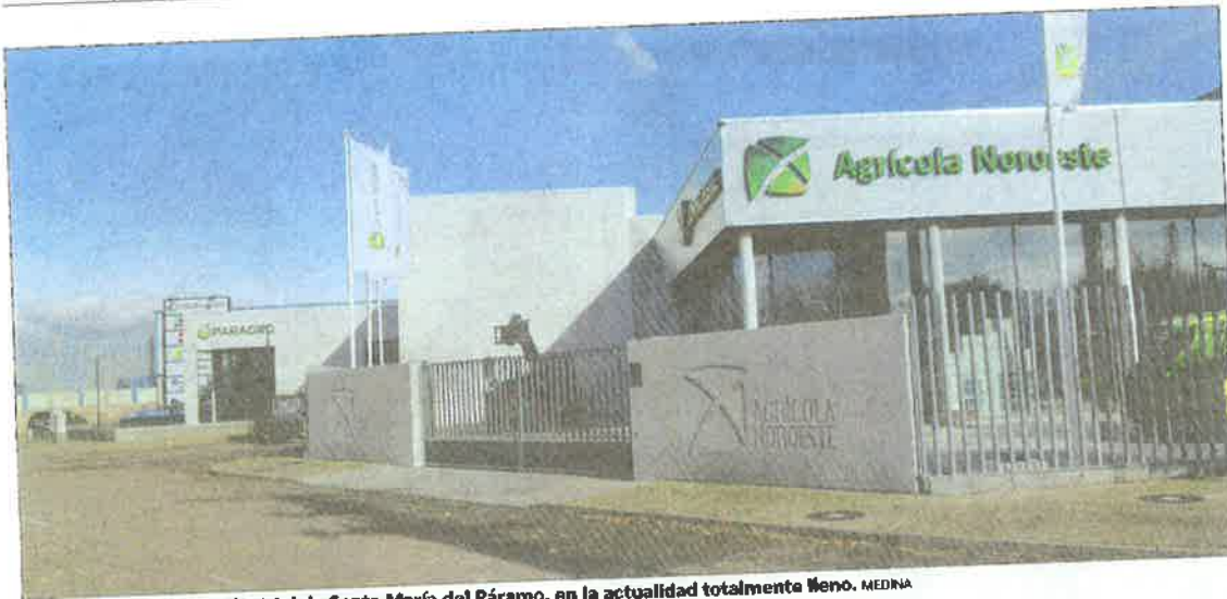
Imagen del polígono industrial de Santa María del Páramo, en la actualidad totalmente lleno. MEDINA