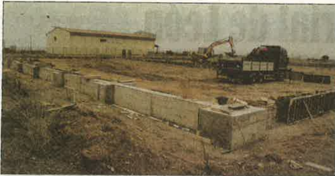
El recinto de Castrillo de las Piedras crece con una nueva nave y otra en proyecto. RAMIRO