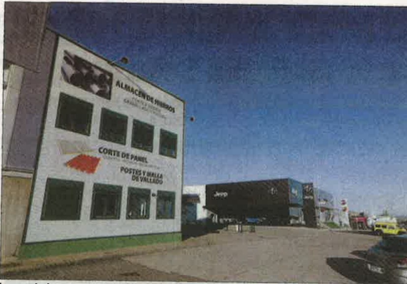
Imagen de dos empresas instaladas en el polígono. MARCIANO PÉREZ

Y es que no hay una zona con unas comunicaciones más directas con el centro que las que ofrece la llegada desde el Portillo para las sociedades que quieren contra con un negocio que se