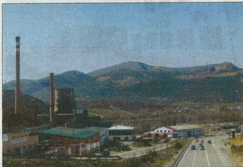
El Rabizo se localiza al sur de La Robla, con enlace directo con la N-630, la LE-4514 y la CL-626. DA

Forja y carpintería metálica, ebanistería, transporte de mercancías, neumáticos, distribución de gasóleo, mecánica del automóvil, suministros industriales y construcción son otros sectores de actividad presentes en un polígono industrial que ocupa una superficie total de 236.579 metros cuadrados, de los cuales 216.787 metros se destinan al uso industrial y 19.69 a si temas generales y zonas verdes.