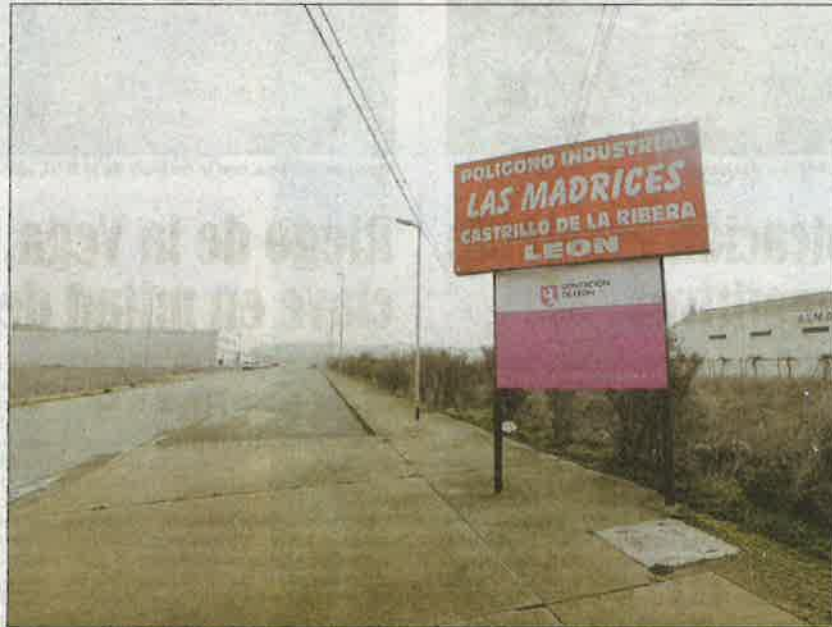
Vista parcial de la actuación en las Madrices, en Castrillo de la Ribera, en Villaturiel. MARCLANO PÉREZ

Más de un centenar de trabajadores están ahora ocupados entre