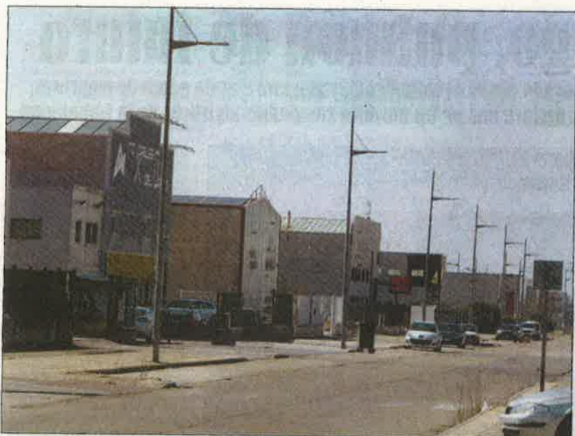
Una vista general en la que se puede apreciar la amplitud del Polígono de Villadangos. MARCIANO PÉREZ