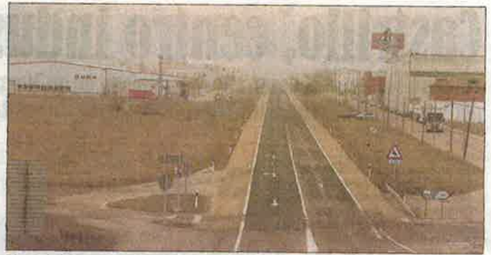
Riego de la Vega, con la travesía de la N-VI, junto a la A-6.