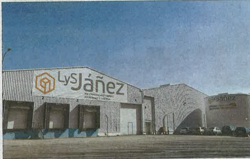
Logística y Servicios Jáñez, una de las empresas instaladas en el polígono de Hospital. MARCIANO PÉREZ

Con el apoyo del Ayuntamiento de Hospital de Órbigo que siempre ha confiado en esta apuesta empresarial y dinamizadora para no sólo la localidad, también el municipio y la comarca, el Polígono Industrial puede presumir también de contar con todos los servicios para que el funcionamiento de las empresas sea el óptimo.