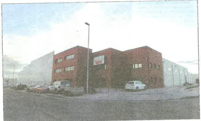
Villarejo sigue apostando por las empresas de la zona. MARCIANO PÉREZ

Las excelentes conexiones de la zona son un acicate para la instalación de nuevas empresas